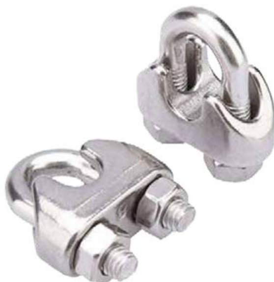
ỐC SIẾT CÁP