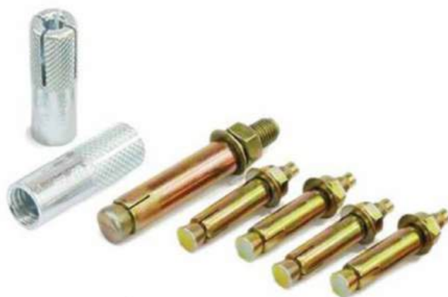
TẮC KÊ ĐẠN