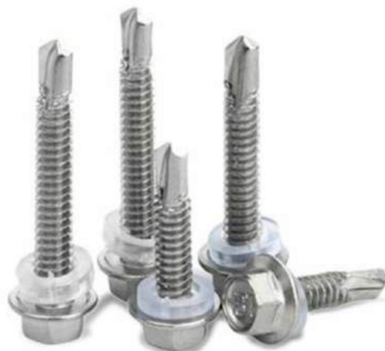
VÍT BẮN TÔN

Bề mặt: Thô, Đen, Mạ điện phân, Mạ kẽm nhúng nóng.